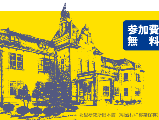
北里研究所旧本館 (明治村に移築保存)